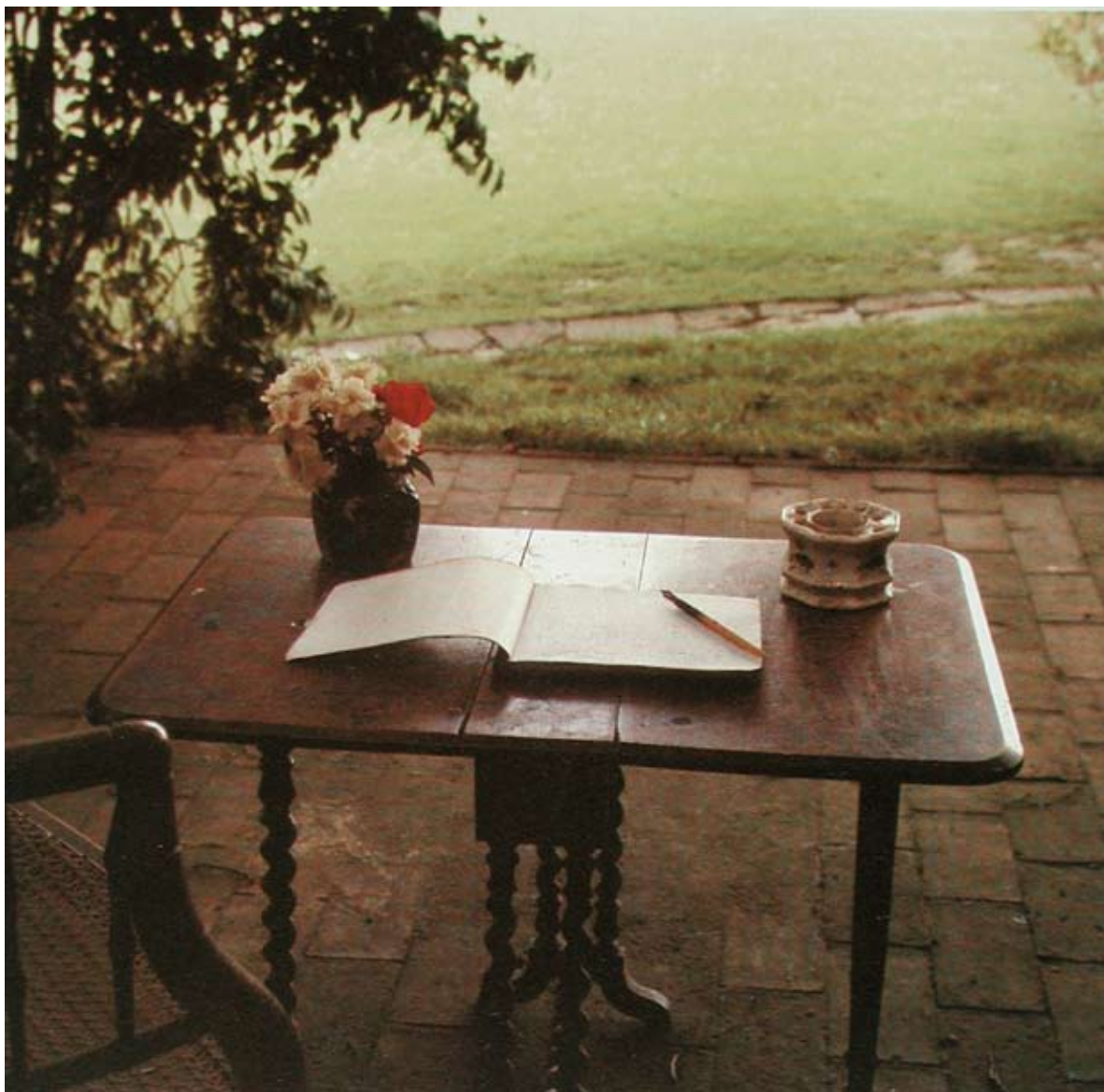
Gisèle Freund, Virginia Woolf's working table, Sussex, ca. 1967